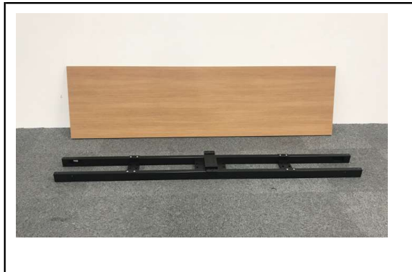
2 W2000天板 2枚/中央梁 1個