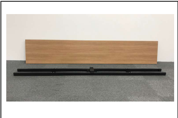
1 上 W3000天板 2枚/下 中央梁 1個