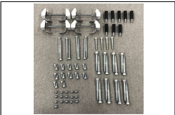
5 天板連結金具 4個/M6×80キャップスクリュー 8個/M6×15キャップスクリュー 24個/M6×45キャップスクリュー 4個/M6×45キャップスクリュー(黒ゴム付)8個/トラスビス 8個/M8×78キャップスクリュー 16個