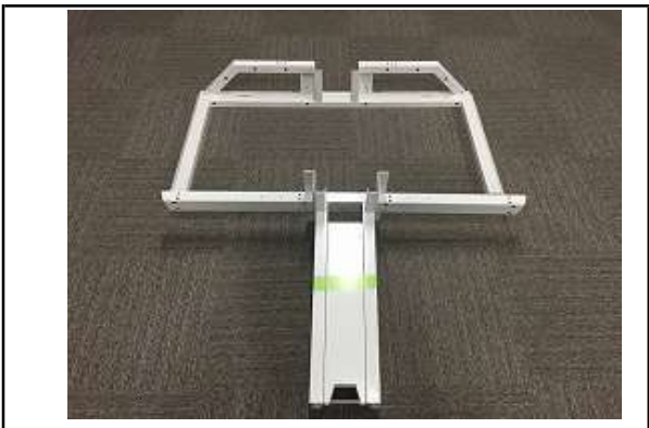
3 上 エンド脚 2個/下 中間脚 1個